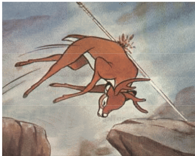
Trecho em que a mãe do veado Bambi é morta com um tiro.

* Desde 1996, a Walt Disney World é anfitriã do dia anual de G.L.S (Gays, Lésbicas e Simpatizantes). Os organizadores do encontro retrataram num desenho animado Mickey e Donald, Minnie e Margarida como amantes homossexuais.