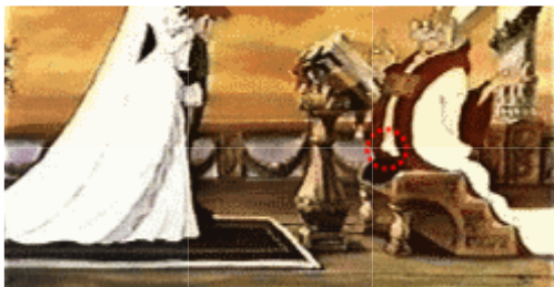
O padre que celebra o casamento de Ariel fica excitado.

Ariel, sereia filha de Netuno 'rei dos mares', que se apaixona por um príncipe (humano). Ela quer se tornar uma humana, porém a Bruxa diz para ela, que quer algo em troca: "Eu quero sua voz e sua alma". Quando a música (Beije a moça) toca no fundo, há um grupo jamaicano falando palavras africanas, lançando maldições para as crianças que assistem.